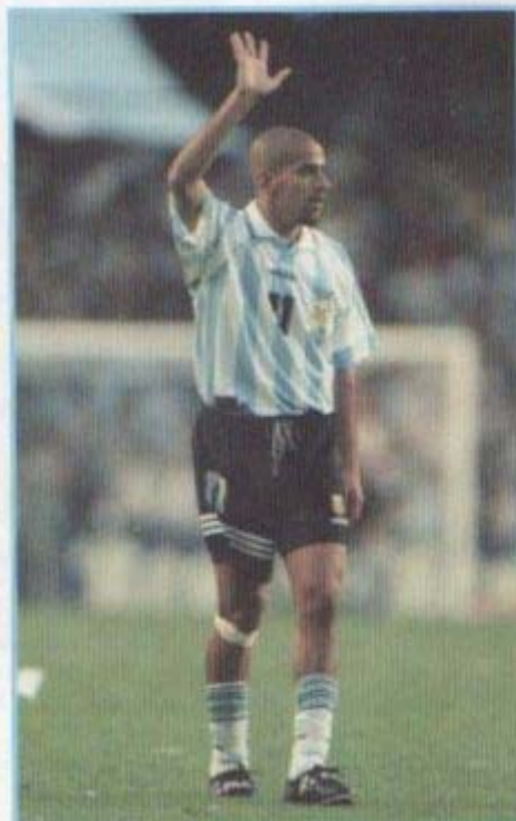
Sebastián Verón, una incógnita rumbo a Alemania 2006.

Blanco ha tenido demasiados problemas, a veces ha renunciado, el Loco lo ha esperado, lo ha hecho jugar y ha sido, y es, importante para el equipo. Pero tampoco se puede decir "hoy quiero jugar y mañana no quiero", o se juega o no se juega. Lo de Verón es diferente porque estuvo mucho tiempo lesionado, y ahora hay muchos chicos que pueden estar.