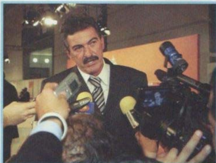
Ricardo La Volpe comparece ante los medios.

- No nos vamos a guiar por los últimos partidos porque, realmente, ya estaba clasificada y no jugó bien. El hecho de que Argentina haya clasificado varios partidos antes de